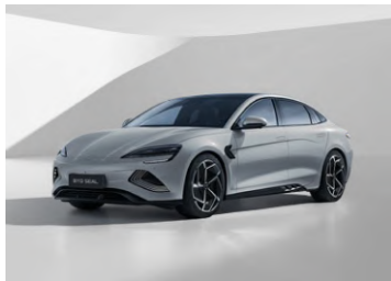
Shadow Green #